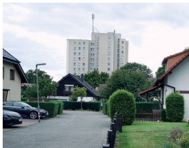
Ein „Siedlungs-Hochhaus“ von der Waldemar-Petersen-Straße aus