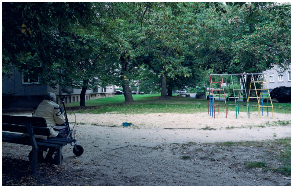
Spielfläche zwischen den Vonovia-Häusern

Die klassischen Bewohner*innen der Siedlung, Arbeiter*innen mit ihren Familien aus den Sechzigerjahren, mussten nunmehr mit den zugewanderten Osteuropäer*innen, ihren unterschiedlichen Lebensgewohnheiten und Kulturen zurechtkommen. „Das heißt, dieses soziokulturelle Milieu hat sich gewandelt.“ Offenbar gefiel das nicht allen, zumal die Vorbereitung durch die Ver-