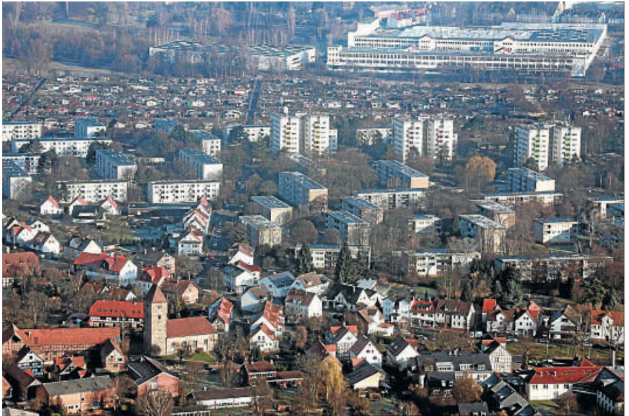
Waldau mit der Wohnstadt im Hintergrund und Alt-Waldau vorne mit Dorfkirche

die Konzentration der Darstellung auf den beiden Teilen des Stadtteils, nämlich Alt-Waldau und der Wohnstadt, liegen. Dennoch bleibt es dabei: „Kassel ist weit weg. Du fährst ja aus Waldau raus, da steht ein Ortschild 'Ende'. Ist 'n Satellit eigentlich.“