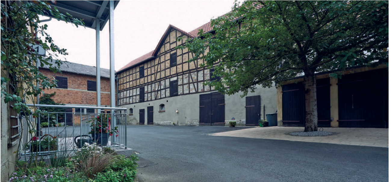
Hof in der Bergshäuser Straße

Verschiedenheiten akzeptiert und immer wieder von Neuem gelebt werden müssen, damit – wie es von einem Bewohner betont wird – „man sich gut aufgehoben fühlt“. Das sind anstrengende Prozesse. Werden sie, so ist zu fragen, von den Waldauer*innen auch so gelebt? Aktuell lebt Waldau von der Verschiedenheit, die aber von einem Graben durchzogen, unsichtbar und unüberwindbar scheint. Und dieser Graben trennt Alt-Waldau und damit die Alt-Waldauer*innen von der Wohnstadt. Hier das dörfliche Alt-Waldau und dort, wie es seit sechzig Jahren noch immer heißt, „die Siedlung.“ Alt-Waldau und die Siedlung – was trennt sie, was führt sie zusammen?