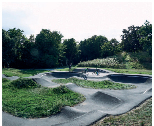
Freizeitgelände Wahlebach „Skaterbahn“

Und noch viel mehr, lässt sich angesichts des Freizeitgeländes am Wahlebach hinzufügen. Vor allem für die Kinder und Jugendlichen hat die Stadt einiges getan: idyllisch gelegene Freiflächen mit gepflegten Wiesen und Spielplatz, eine Skaterbahn und ein Bolzplatz mit fest installierten Kleintoren. Fraglich bleibt angesichts der häufig anzutreffenden Leere dieser Freizeiteinrichtungen, ob tatsächlich alles getan worden ist, um eine nachhaltige Nutzung durch die Bewohner*in-