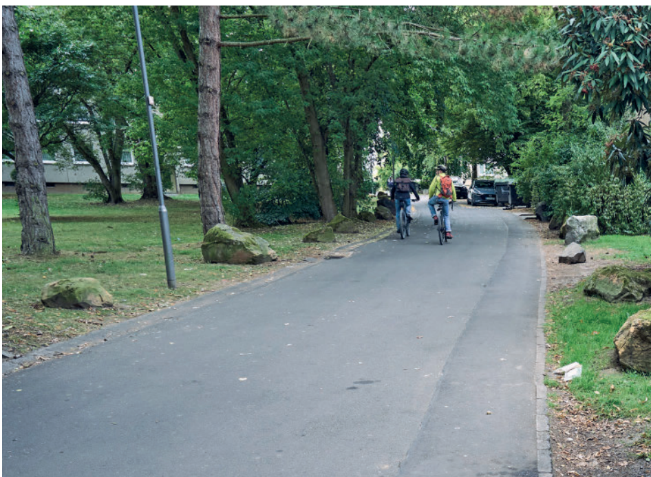
Fuß- und Radweg in der Wohnstadt

Und so kam es zu einem kleinen Neubaugebiet, das architektonisch doch einige Besonderheiten