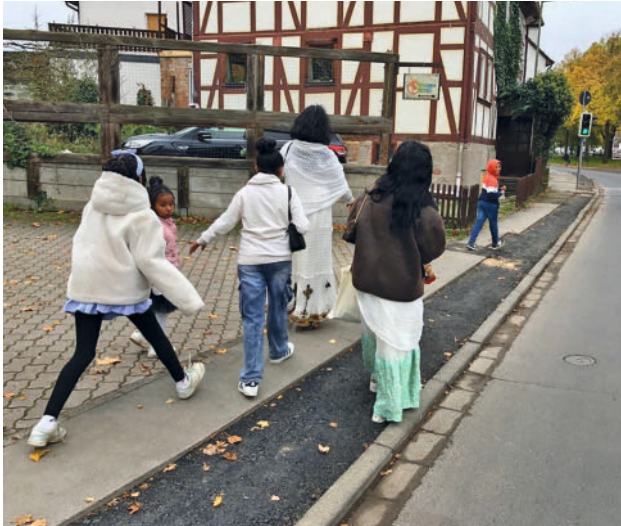
Migrantische Kinder mit ihrer Mutter in Alt-Waldau auf dem Weg zum Umzug der „Entenkirmes“