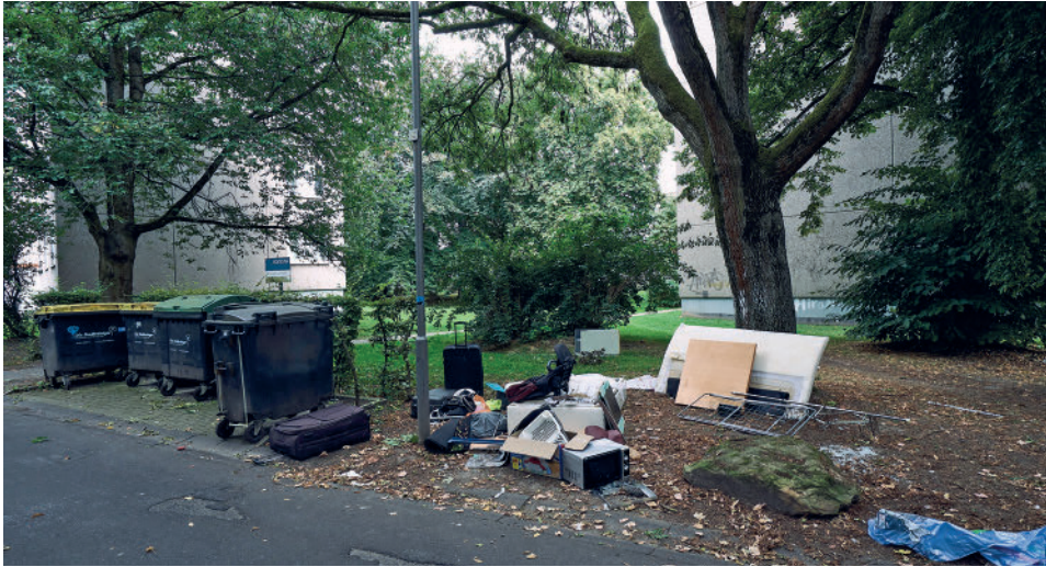
Müll der Vonovia-Häuser

An den anschließenden rasenden Nachtfahrten waren Schüler der Schule beteiligt.“ 6