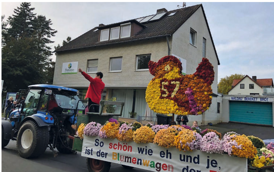
Umzugswagen bei der „Entenkirmes“ 2024

Wie auch immer, dem Umzug wird allenthalben gerne zugeschaut, zumal das ein oder andere Bonbon von den migrantischen Kindern aufgefangen wird. So lässt sich auf jeden Fall resümieren: „...das Vereinsleben findet in Alt-Waldau statt.“ Nicht ganz, würde jetzt ein Mitglied der über 400 Vereinsmitglieder des Kleingartenvereins Forstgelände e.V. am Rande des Wahlebachs einwenden. Der besteht nämlich aus einer Mischung von Bewohner*innen Alt-Waldaus, der Wohnstadt und, nicht zuletzt, aus einer nicht unerheblich großen Zahl von „Russlanddeutschen“. Wenn man