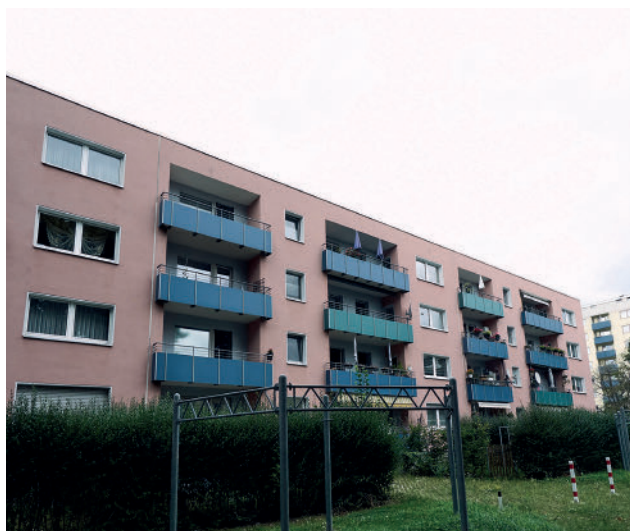
Häuser der Wohnstadt Waldau mit Eingang