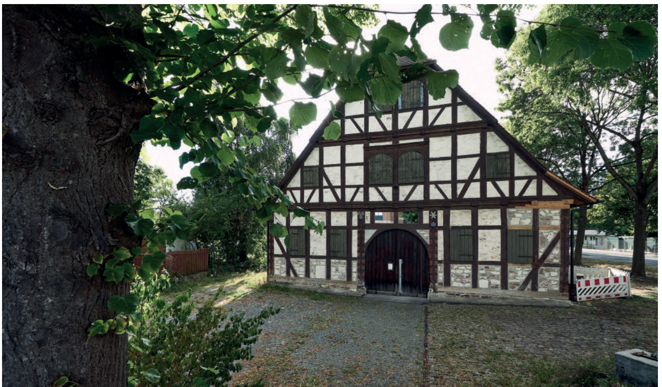
Die Zehntscheune in Waldau

Dies wiederum ging einher mit dem partiellen Verlust seines dörflichen Charakters, wenngleich vor allem die zahlreichen Fachwerkbauten in Alt-Waldau noch immer als ein Dorf erscheinen liebten. Umso schmerzlicher dürfte es gewesen sein, dass ein großer Teil der landwirtschaftlich ge-