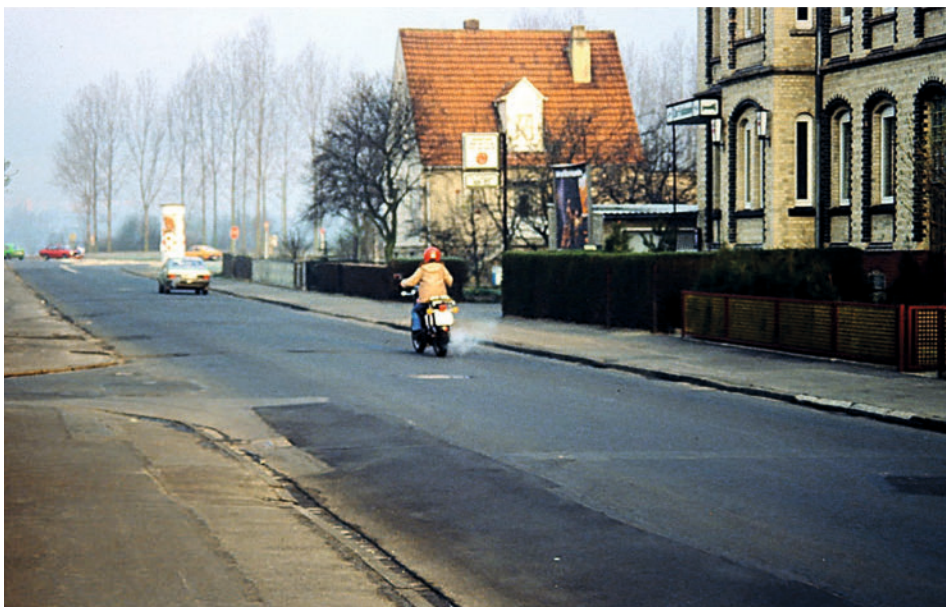
Die Bergshäuser Straße Anfang der achtziger Jahre noch mit direktem Zugang zur B83

Aber wie geht's nun raus aus Waldau? Da gibt's denn mehrere Möglichkeiten: Innerhalb der Stadtgrenzen nach Forstfeld oder über den Wahlebach nach Bettenhausen oder, ganz aus Waldau und der Stadt raus, schon in den Landkreis nach Bergshausen oder östlich nach Lohfelden und den Industriepark Waldau. Alles (mehr oder weniger) gut mit dem Fahrrad erreichbar, sicherer allerdings mit dem PKW. Als Fußgänger, der in die Innenstadt möchte, bist du in Waldau ohnehin verloren oder mal locker eine gute Stunde unterwegs, wenn du nicht gerade zur Arbeit nach Bettenhausen in die Lilienthalstraße willst. Ich bevorzuge allerdings den bequemen Weg mit dem Fahrrad zurück in die Innenstadt über den berühmten „Waldauer Fußweg“. Berühmt deshalb, weil er zu den „Waldauer Wiesen“ führt. Ganzen Generationen Kasseler Freizeitsportler*innen, Vereinen und Schüler*innen stehen hier seit Jahrzehnten eine große Zahl von Sportflächen und Fußballplätzen zur Verfügung. Nicht länger als 10 bis 15 Minuten mit dem Rad von Waldau und, von der Stadt her, über die Drahtbrücke oder die Wal-