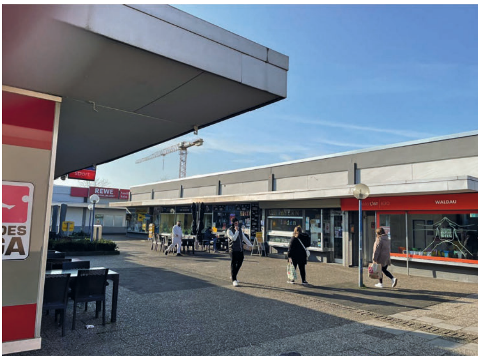
Das Einkaufszentrum Waldau vom REWE-Markt aus fotografiert

Festzustellen ist, wie es etwas sperrig in der ISEK-Studie formuliert wird, dass es „hier keine räumliche Struktur einer ‚Stadtmitte‘“ gibt. Es bleibt also die Geschichte der Siedlung als eine eigene, die als gewaltiges Bauprojekt mit für Kassel historischem Ausmaß begann und noch heute für Waldau einen prägenden Charakter trägt. Es