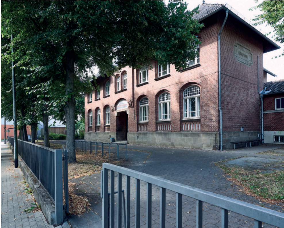
Das Bürgerhaus in Waldau heute

Dabei fällt wohl kaum mehr ins Gewicht, dass die Beschäftigten nur noch zu einem geringen Teil aus der Wohnstadt in den Industriepark pendeln dürften, weil sie ihre Beschäftigung über die gesamte Stadt verteilt bzw. bis hin zu Volkswagen in Baunatal gefunden haben.